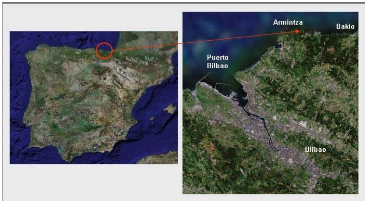
Figura 1. Emplazamiento de la infraestructura bimep.

La infraestructura bimep se ubicará en la costa vizcaína, en aguas de la localidad de Lemoiz , frente al pueblo pesquero de Armintza , como muestra la Figura 3 y 4, donde se instalará el centro de investigación y recogida de datos. El área reservada para este fin será un polígono de unos 5,3 Km 2 dejando un canal al tráfico marítimo de 1.700 m frente la costa de Armintza.