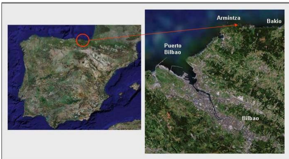
Figura 1. Emplazamiento de la infraestructura bimep .

La infraestructura bimep se ubica en la costa vizcaína, en aguas de la localidad de Lemoiz, frente al pueblo pesquero de Armintza, como muestran las Figuras 1 y 2.